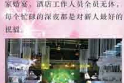
二楼爱琴海 浪漫一生婚礼(50桌)