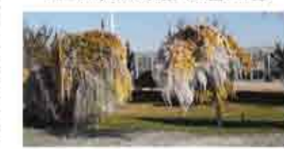
图三：塞北风光，源于华源生态园。