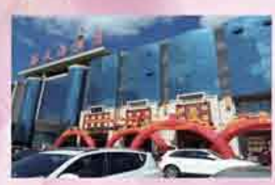
一楼原生态大厅 五福之地婚礼(40桌)

金秋十月，在这普天同庆的日子里，朋友圈都开启了假期模式，有人在热带海岛上呼吸着新鲜空气，有人在5A景区感叹着祖国的壮丽山河。不过，我们海天海酒店不走走寻常路，我们哪都没去！