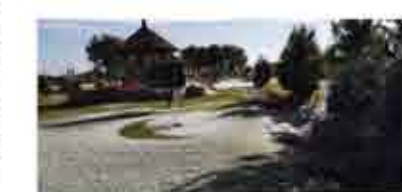
图四：来自大自然的馈赠，大珠小珠落玉盘。