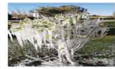
图二：冰霜压绿植，绿植挺且直。