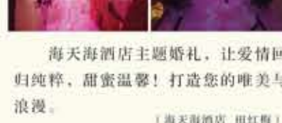
海天海酒店主题婚礼，让爱情回归纯粹，甜蜜温馨！打造您的唯美与浪漫。