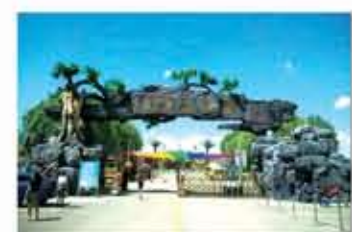
守护游客的“诗与远方”

华源生态园作为雁北地区最具影响力的生态园，合理规划、提前部署，在“五一”小长假到来前已将园区打造一新。设施设备检修合格，各类专业人员全部到岗，并成立应急小组，制定应急预案，为游客的安全保驾护航。