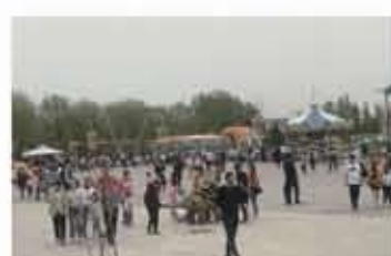
假日旅游消费旺盛 生态园亮点纷呈

(二)优服务，出行更便利：扎实推进“宾客至上”理念，不断提升假日旅游公共服务水平，强化假日旅游宣传引导，为游客出行提供便利。